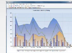
Opcenter AP Ultimate

Freie Konfigurier- barkeit von Struk- turen und Regeln API Support