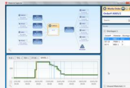
Opcenter AS Professional

Vollfunktionales Scheduling mit Standard- Strukturen